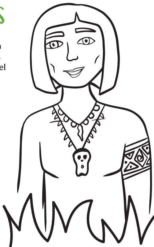
Dibujo por: Ashlie Cordero

Nosotros hemos heredado mucho de ellos y por eso nos debemos sentir orgullosos de nuestras raíces.